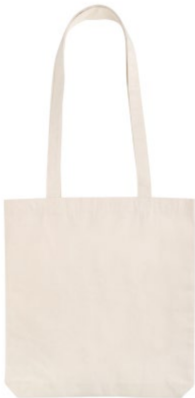
Сумка из переработанного хлопка