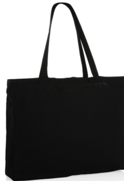
Сумка-шоппер из переработанного хлопка 145 г.